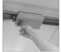
Fig. 1 sblocco motore

procedere come segue: sbloccare con apposita chiave, sfilando verso l'esterno il blocchettino e tirando verso il basso con moderazione la fune di blocco. Sbloccare periodicamente la porta e controllate che manualmente il movimento sia fluido e progressivo e non presenti punti di forza, nel caso ciò non avvenga chiamate l'assistenza. Ciò permetterà al tecnico di valutare il problema dando disposizioni in grado di evitare pericoli a persone, animali o danni a cose e al portone stesso;